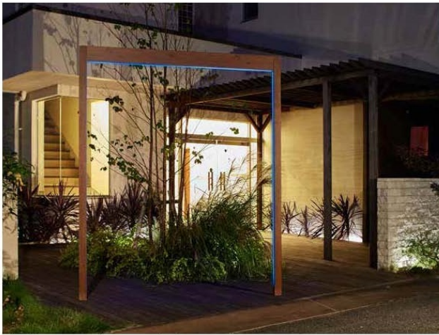
エバースクリーンフレームライティングフェイス(本体カラー:ダークグレイ LEDカラー:電球色)

ホームヤードルーフ®システム/エバースクリーン® フレーム ライティングフェイス 3月発売予定