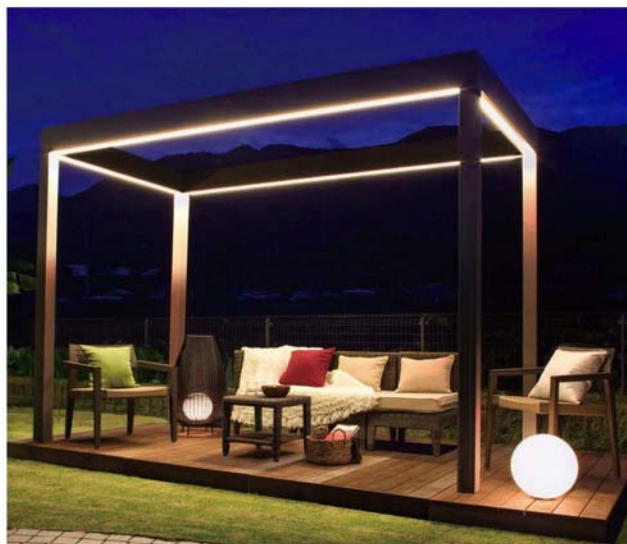
使用イメージ(ホームヤードルーフシステムルーフ 別注仕様)