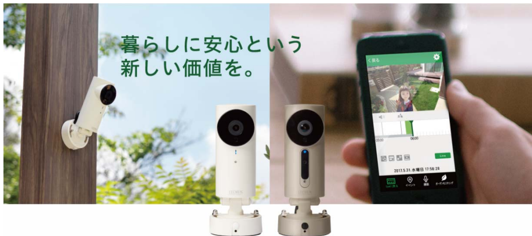
【LEDIUS Cam 使用イメージ】

『LEDIUS Cam』とは、従来から当社にて展開している、電気工事士資格がなくても施工ができるローボルト®システムに接続が可能なカメラです。撮影した画像はご自宅のWiFiを経由してクラウドサーバにアップされ、無料の専用アプリをインストールしたスマートフォンやタブレットを使って離れた場所からでも視聴が可能です。