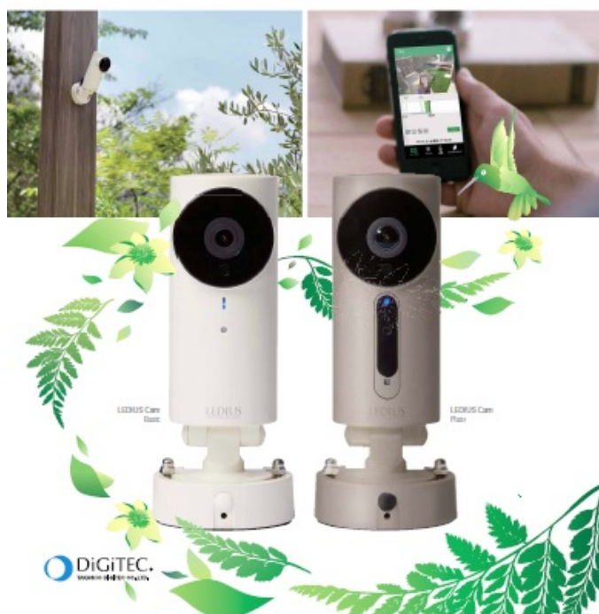
【LEDIUS Cam (レディアスカム)】