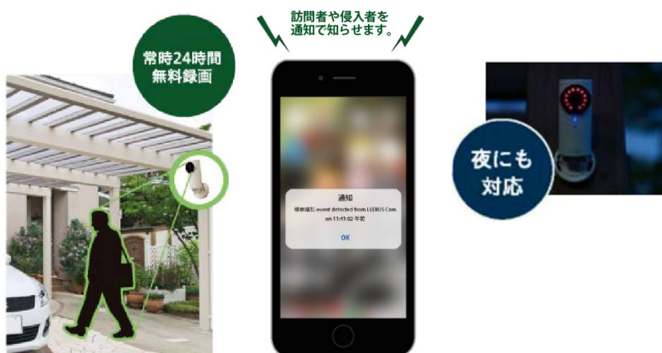
【特長① セキュリティ効果 イメージ図】