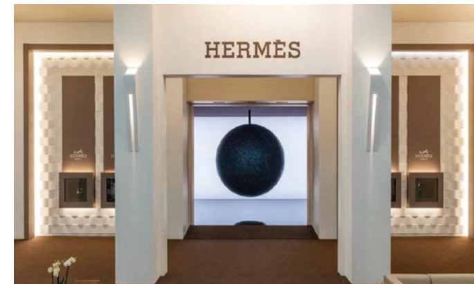
Here (2019) : Hermes