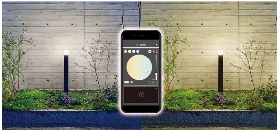
【自由自在な演出設定 イメージ図】

スマートスピーカー（Amazon Echo、Google Home など）と連動すれば音声コントロールも可能。アプリからでもスマートスピーカーからでも簡単操作で様々なお庭の演出を楽しむことができます。