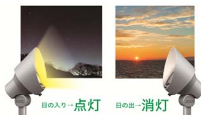
【点灯・消灯時 イメージ図】