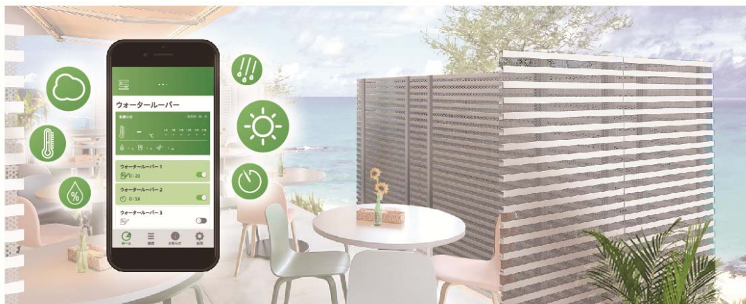
【ドリップルーバー イメージ図】

両社は、今後も最新のIoT技術を活用し、地球環境や住む人に優しい豊かな住環境づくりに取り組んでいきます。