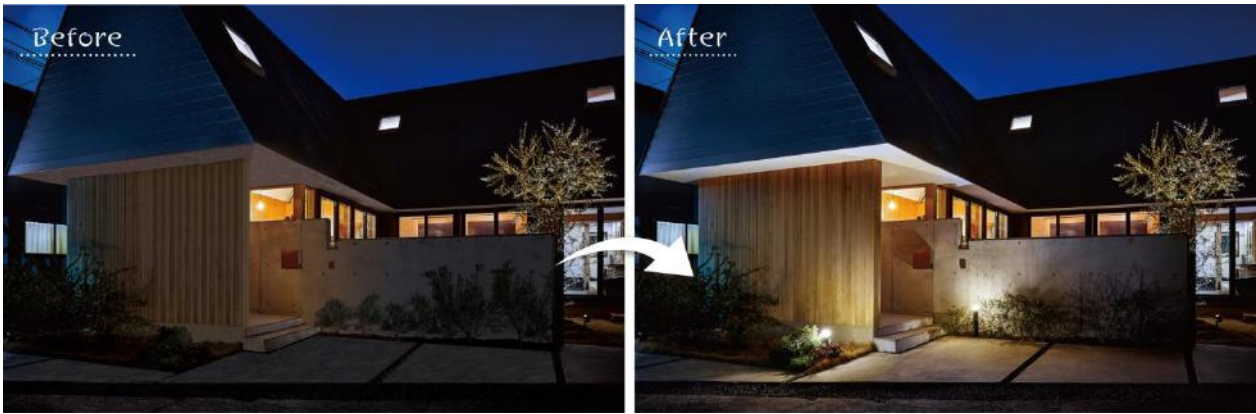
【間のひかり 設置前後のイメージ】