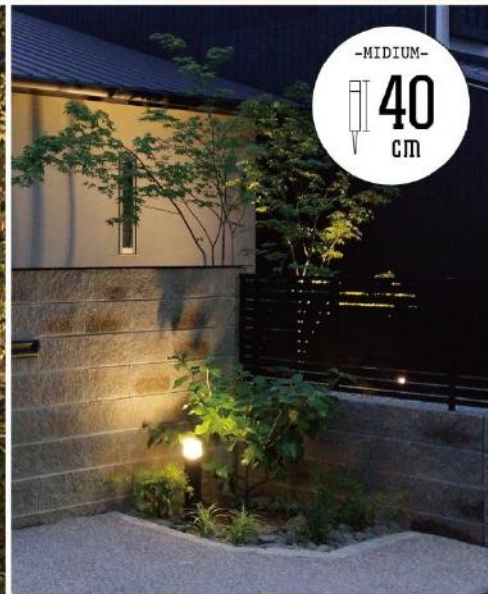
【間のひかり ポール組み合わせイメージ】