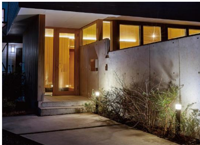
【間のひかり 使用イメージ】